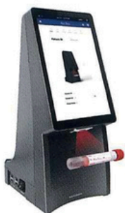
Zeskanuj kod próbki