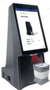
Zeskanuj kod kartridża