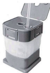
Dodaj próbkę i zamknij kartridż